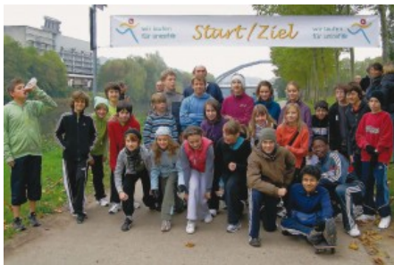
Unicef-Lauf 2010

Am Freitag, 15.10.2010, dem letzten Schultag vor den Herbstferien des DFG, fand die traditionelle Schul-Laufveranstaltung „Run for help“ zugunsten von UNICEF statt. Alle beteiligten Läufer (insgesamt fast 800 deutsche und französische Schülerinnen und Schüler) stehen nun vor der Aufgabe, für die erlaufenen Kilometer großzügige Sponsoren zu finden.