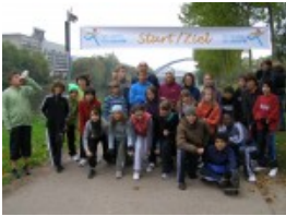
Startvorbereitungen der Klasse 5ebic1

Das Konzept der Schulaktion „Laufen für UNICEF“, sieht vor, dass die Hälfte des erlaufenen Betrages - in diesem Jahr also über 8.000 € - für soziale, humanitäre oder individuelle Schulzwecke bei der Schule verbleibt, während die andere Hälfte - ebenfalls 8.000€ - direkt in das UNICEF-Projekt „Laufen für Schulen in Afrika“ einfließt.