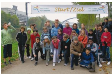
Course pour l'UNICEF 2010

Vendredi 15 octobre 2010, dernier jour d'école avant les vacances de la Toussaint au LFA, a eu lieu la traditionnelle course du lycée „Run for help“ au profit de l'UNICEF. Tous les participants à la course (environ 800 élèves français et allemands) ont désormais pour mission de trouver de généreux sponsors qui financeront les kilomètres qu'ils ont parcourus.