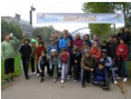
Startvorbereitungen der Klasse 5ebic1

Das Konzept der Schulaktion „Laufen für UNICEF“, sieht vor, dass die Hälfte des erlaufenen Betrages - in diesem Jahr also über 8.000 € - für soziale, humanitäre oder individuelle Schulzwecke bei der Schule verbleibt, während die andere Hälfte - ebenfalls 8.000€ - direkt in das UNICEF-Projekt „Laufen für Schulen in Afrika“ einfließt.