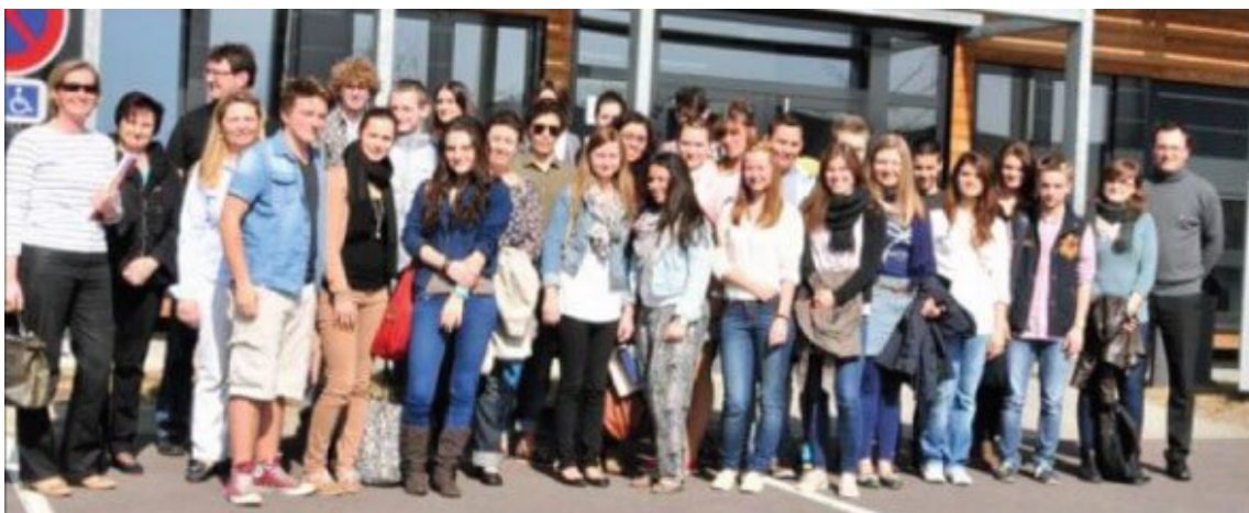
Elèves du LFA à la pépinière d'entreprises Eurodev