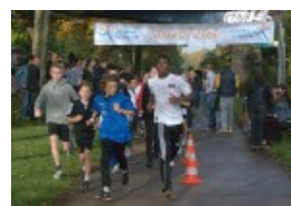
Départ de la classe 7b

En dépit de la crise économique et du manque d'ardeur de la part des donateurs, l'engagement des élèves pour le projet de l'UNICEF « Des écoles pour l'Afrique » ne faiblit pas : Aussi le montant des dons, qui s'élève à 17583,21 €, a-t-il battu un nouveau record pour notre 10ème « Run for help ». Et ceci en dépit des températures élevées qui régnaient cette année et qui ont eu pour conséquence qu'un grand nombre de participants à la course se soit contenté de parcourir la distance minimum imposée, à savoir 8 km. Il a tout bonnement fait trop chaud !