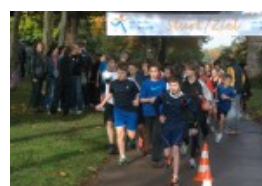
Départ de la classe